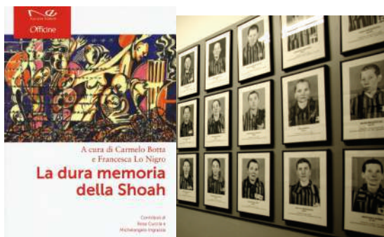
IMMAGINE DI COPERTINA PROVVISORIA

Navarra Editore Categoria: Saggistica Collana: Officine Anno: 2017 Pagine: 144 Prezzo: 12,00 € ISBN: 978-88-98865-51-2 Formato: 14X21